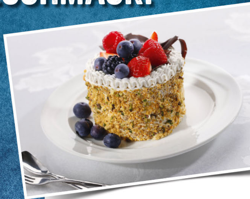
Crème Pâtisserie gesüßt 1 L 25% Fett