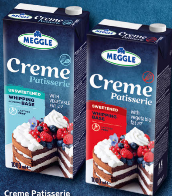
Crème Pâtisserie ungesüßt 1 L 25% Fett