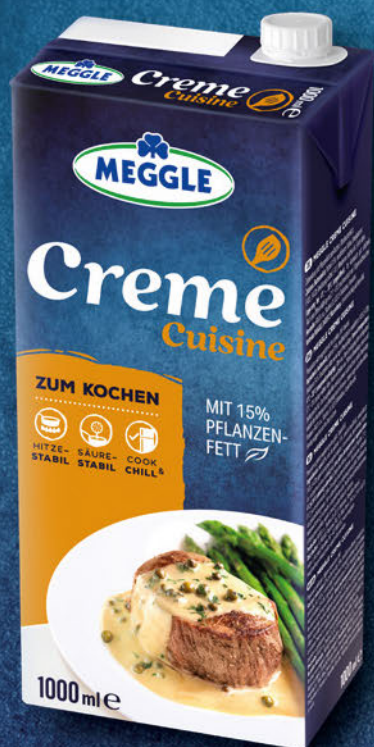
Creme Cuisine 1 L