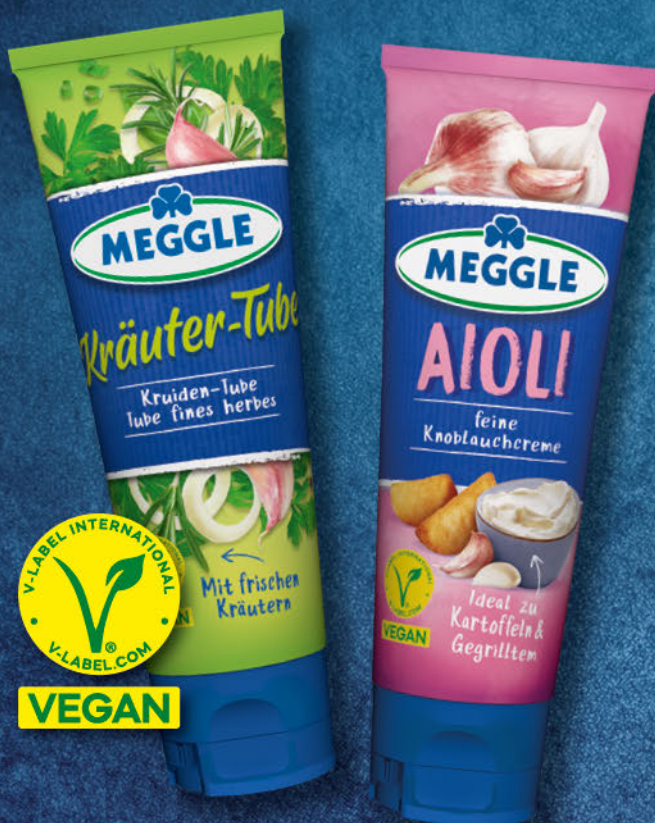
Kräuter vegan Tube 80 ml