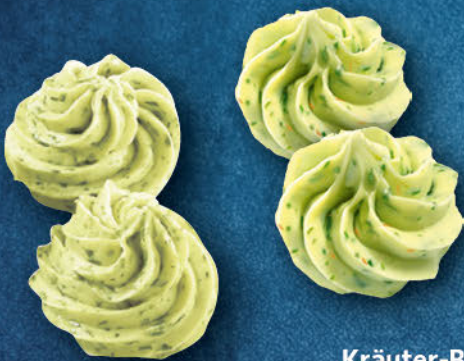
Kräuter-Butter Rosetten mit Knoblauch 10 g